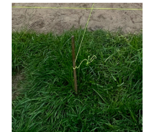
uitzettouw en piketten