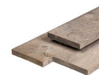
2 houten planken